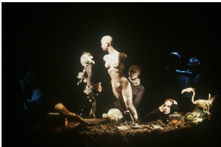
Samotnosc - Solitude - d'après Bruno Schulz

Le Clastic Théâtre invente, depuis 1984, sous la direction de François Lazaro, un travail de création théâtrale avec des interprètes, des pantins, des mannequins, des marionnettes, des objets, des matériaux, pour explorer les écritures théâtrales d'aujourd'hui. La recherche d'une écriture contemporaine pour et par un corps extérieur au comédien, constitue l'axe prioritaire de cette démarche.